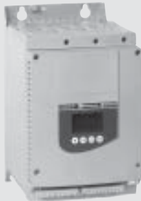
Altistart 48 17 - 1200 A

İlgili TeSys komponentleriyle performansınızı artırın*