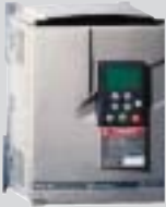
Altivar 58 0.37 - 75 kW