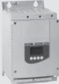
Altistart 48 17 - 1200 A

İlgili TeSys komponentleriyle performansınızı artırın*