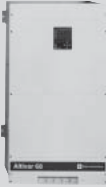
Altivar 68 75 - 630 kW