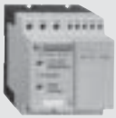
LH4 6 - 85 A